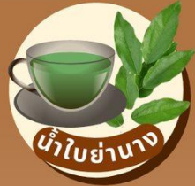
น้ำใบย่านาง