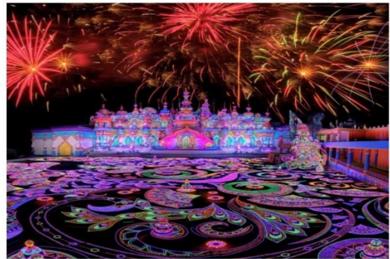
Phuket, Thailand Family thrills