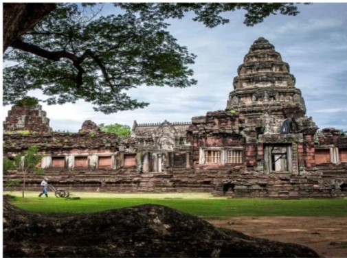
Isan, Thailand Unique culinary capital