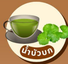
น้ำบัวบก