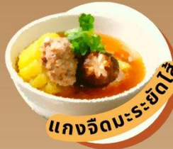
แกงจืดมะระยัดไส้