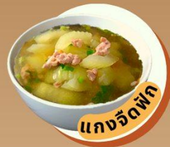
แกงจืดผัก