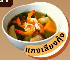
แกงเลียงกุ้ง