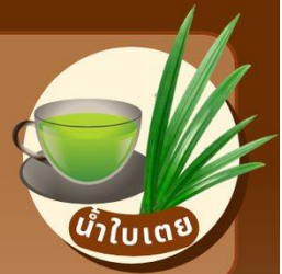
น้ำใบเตย