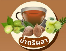
น้ำตรีผลา