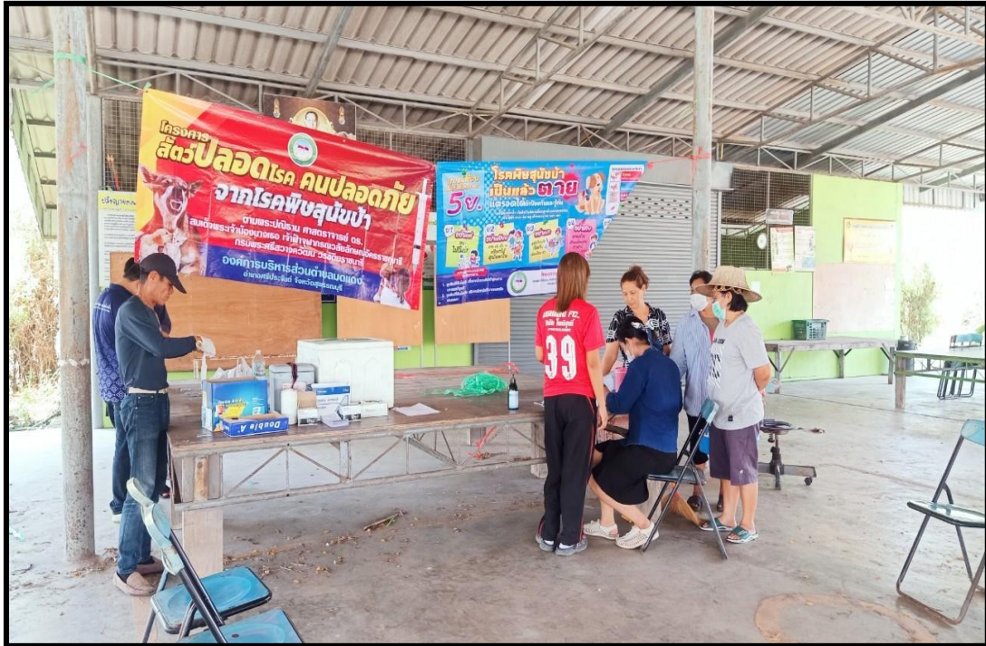
ป้องกันและควบคุมโรคด้วยการฉีดวัคซีนป้องกันโรคพิษสุนัขบ้า ณ ศาลา SML หมู่ที่ ๖ ตำบลมดแดง จำนวน ๒๒๐ ตัว