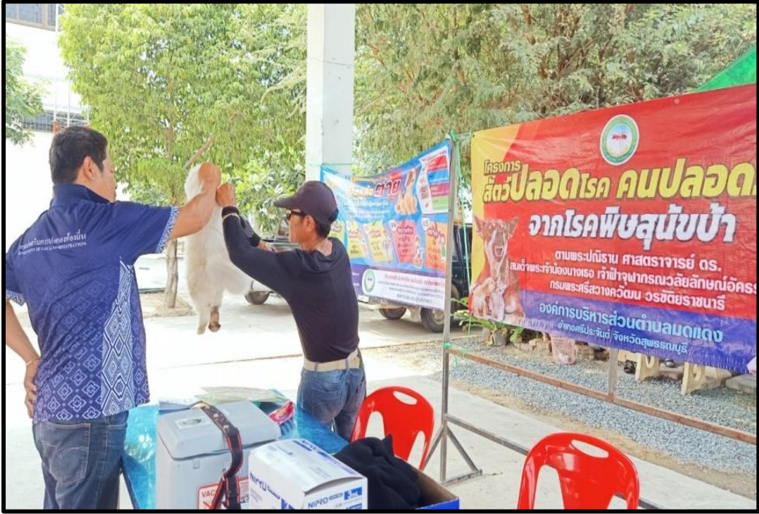
ป้องกันและควบคุมโรคด้วยการฉีดวัคซีนป้องกันโรคพิษสุนัขบ้า ณ อบต.มดแดง หมู่ที่ ๒ จำนวน ๗๓ ตัว