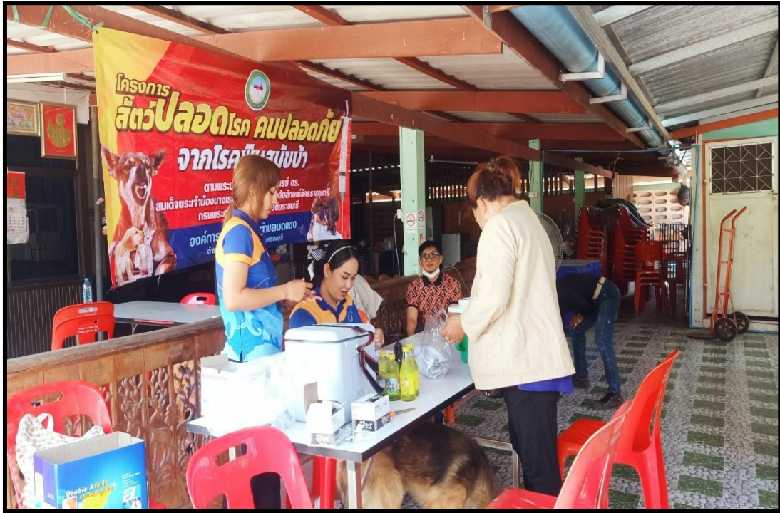
ป้องกันและควบคุมโรคด้วยการฉีดวัคซีนป้องกันโรคพิษสุนัขบ้า ณ ที่ทำการผู้ใหญ่บ้าน หมู่ที่ ๓ ตำบลมดแดง จำนวน ๑๖๔ ตัว